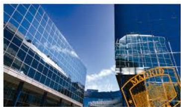
III CONGRESO NACIONAL DE COMPLIANCE

Socios de nuestro equipo asistieron el día 14 de diciembre al III Congreso Nacional de Compliance que se celebró en la Fundación Giner de los Rios en Madrid.